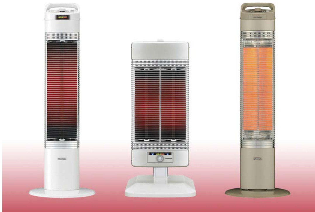
左からコアヒートスリム、コアヒート、スリムカーボン