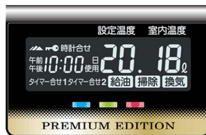
説明の為、全点灯表示としています。

WXシリーズは、「大型白文字バックライト液晶」表示を採用しています。暗い場所でもよく見えるバックライト液晶と大きな文字表示で、運転状態の視認性が向上しました。また、操作パネルは見やすく、操作しやすいボタンの大きさと配置にしております。